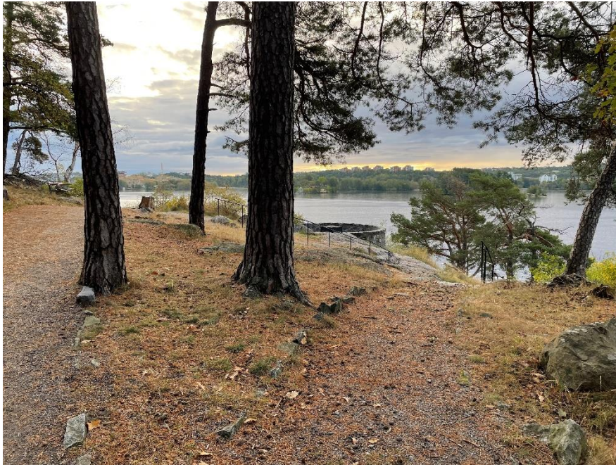
Figur 2. Strandpromenaden i Ålstensskogen erbjuder olika naturupplevelser, lugn och ro men även platser för sociala möten.