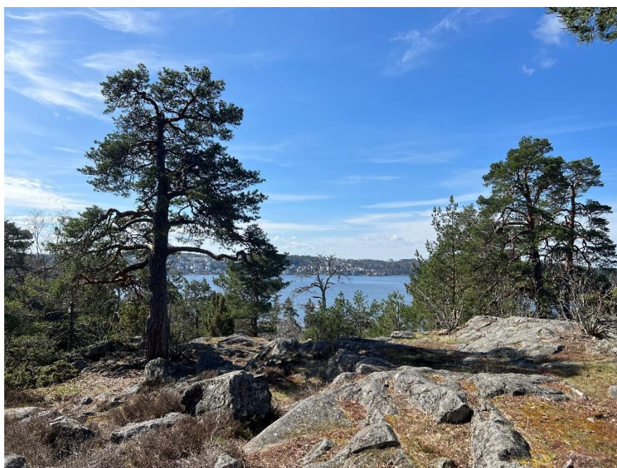
Figur 1. I Ålstensskogen och Storskogen finns värdefulla barrskogsmiljöer med vackra gamla tallar.

Ålstensskogen och Storskogen utgör en viktig värdekärna i stadens grönbå infrastruktur. Cirka 67 procent av området bedöms vara värdekärna för biologisk mångfald, ur ett regionalt och nationellt perspektiv. Värdena är främst knutna till gamla sammanhängande barrskogar som domineras av gamla tallar, men även till de kulturpräglade ädellövs- och gräsmarkerna samt en art- och individrik fladdermusfauna.